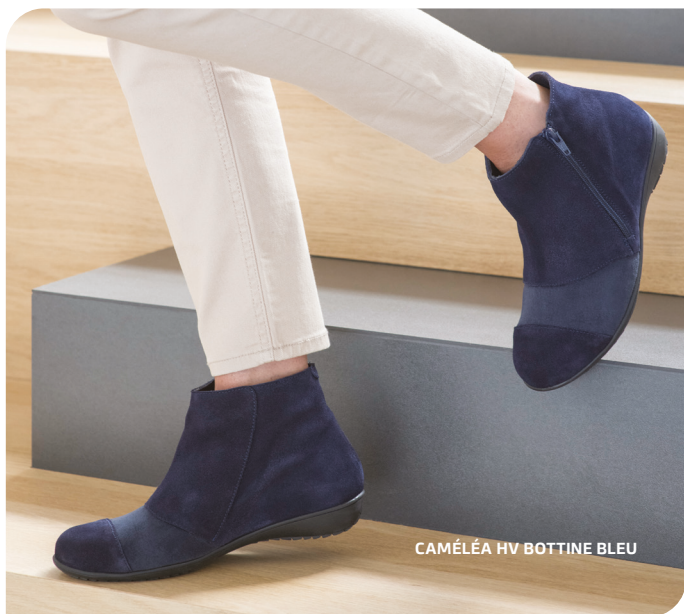
CAMÉLÉA HV BOTTINE BLEU