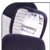
Étiquette de personnalisation